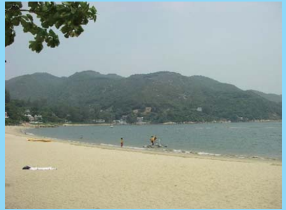
景色優美的銀礦灣泳灘