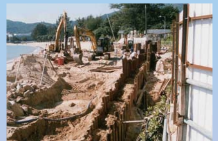
於涌口村進行的渠務建築工程